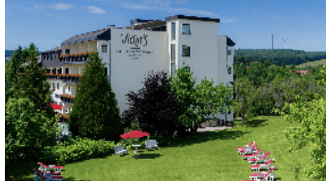
Victor´s Seehotel Weingärtner am Bostalsee • Bostalstraße 12 66625 Nohfelden-Bosen

Deutsche Metall GmbH Boehingerstraße 2a 68307 Mannheim